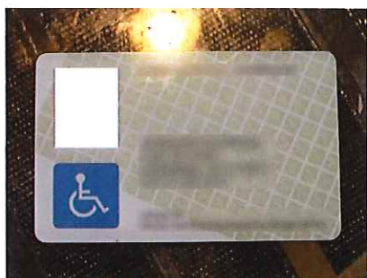
デンマーク 障がい者カード 表

・観光施設の利用料割引については、割引のある施設に行かなかった人がほとんどですが、日本の障害者手帳の提示が必要で、デンマークの「障がい者カード」が適応にならず割引を受けられなかったという声が聞かれました。