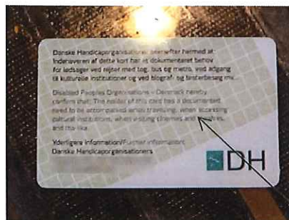
デンマーク 障がい者カード 裏

Disabled Peoples Organisations · Denmark hereby confirm that: The holder of this card has a documented need to be accompanied when travelling, when accessing cultural institutions, when visiting cinemas and theatres, and the like.